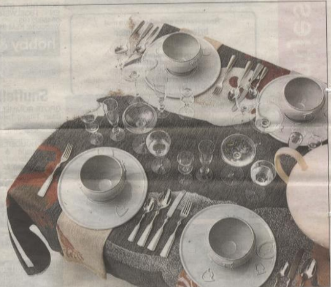
Het tafellinnen van Kiki van Eijk is geïnspireerd door illustraties uit oude kookboeken. Haar servies doet denken aan de middeleeuwse schranspartijen.

Op initiatief van het Textielmuseum in Tilburg bedachten de ontwerpers Scholten & Bajings en Kiki van Eijk tafeldamast, servies, bestek en glazen. Hun gedekte tafels zijn tot en met 21 maart te zien in het museum.